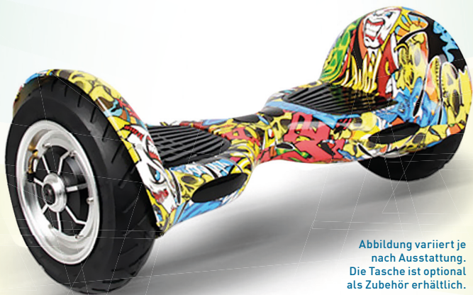
Abbildung variiert je nach Ausstattung. Die Tasche ist optional als Zubehör erhältlich.

Der Scooter für In- und Outdoor mit 10" Luftbereifung